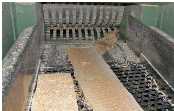
Vibrorinne transportiert das Stückgut von Gatter und Bandsäge zu den Hackwerkzeugen

Der Hacker wird mittels Vibrorinne beschickt. Diese ist mit einer metallfreien Zone ausgeführt. Der trapezförmige Fördertrog sorgt für eine stö-