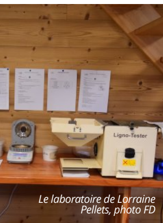
Le laboratoire de Lorraine Pellets

La matière humide rejoint ensuite un séchoir à basse température de marque Urbas, à bande à double passage (2 x 50 m) et d'une capacité horaire de 10 tonnes sèches. L'air de séchage est réchauffé à 85 °C par la chaudière. En sortie de séchoir, la matière sèche séjourne dans un troisième silo en béton de 1 900 m 3 avant un dernier affinage, une opération réalisée dans le local de granulation dans une zone ATEX. En sortie d'affineur sec, la matière est ramenée à l'humidité requise par le processus de granulation. Elle est ensuite soigneusement homogénéisée par brassage et rejoint les trémies de dosage des deux presses de 6 tonnes/h. Notons que les presses sont protégées des explosions par un système de détection d'étincelles, et de la présence de métaux ou