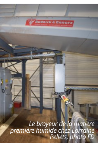
Le broyeur de la matière première humide chez Lorraine Pellets