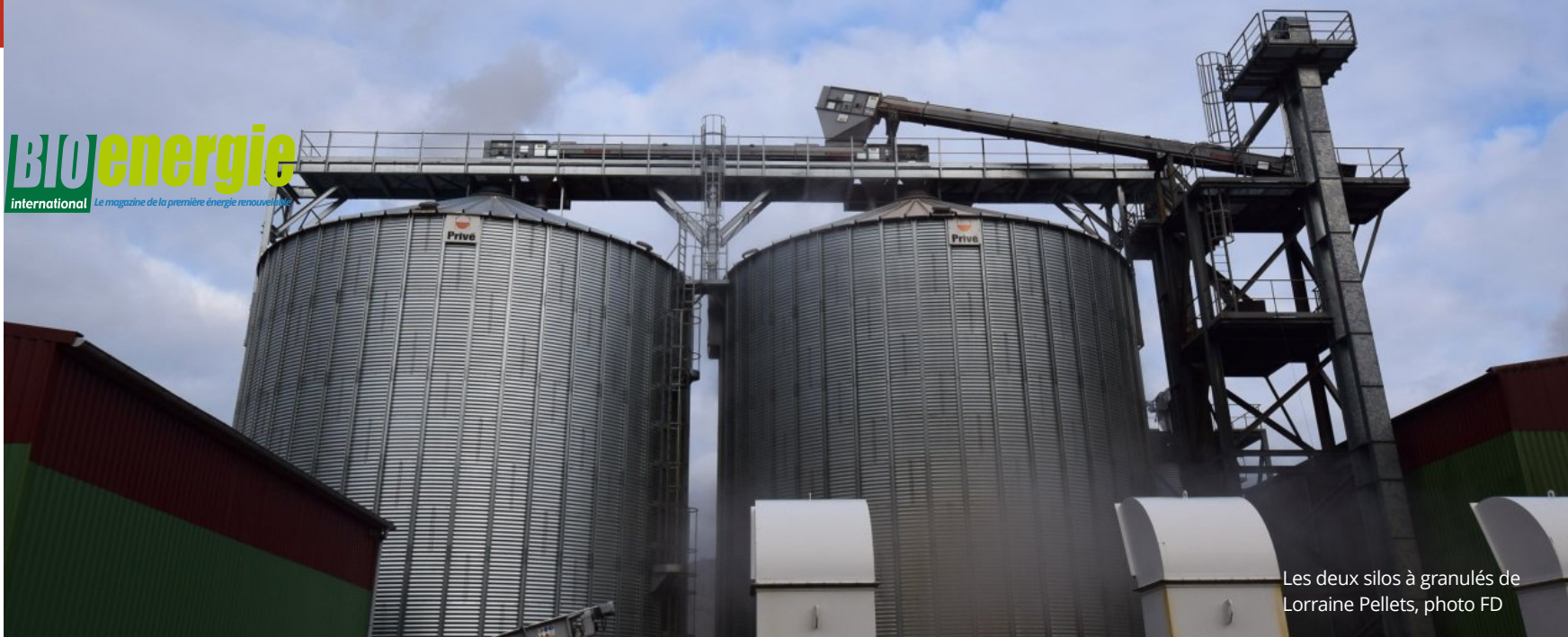
Les deux silos à granulés de Lorraine Pellets