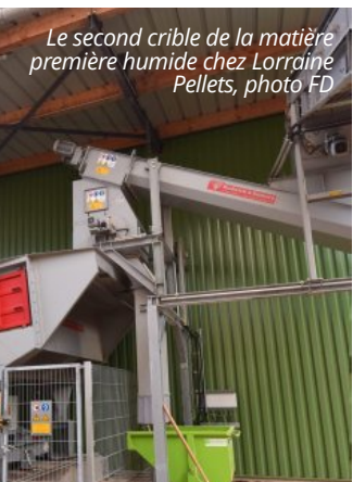
Le second crible de la matière première humide chez Lorraine Pellets, photo FD