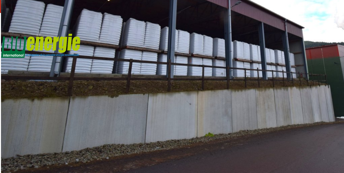
Le hangar de stockage des palettes de granulés

BIO energie international la première énergie renouvelable