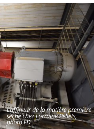
L'affineur de la matière première sèche chez Lorraine Pellets