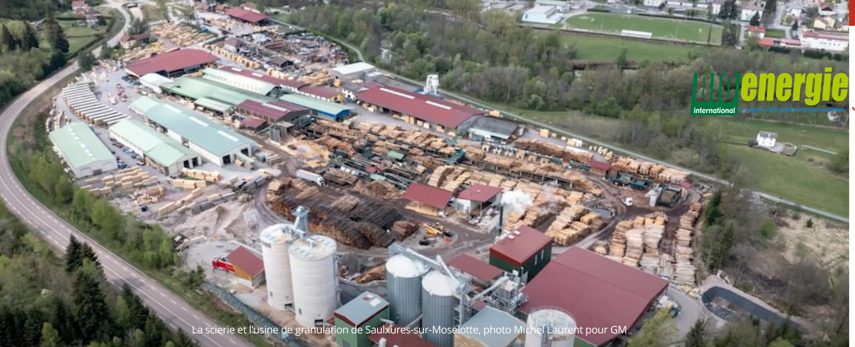
La scierie et l'usine de granulation de Saulxures-sur-Moselotte