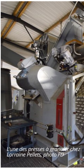
L'une des presses à granuler chez Lorraine Pellets