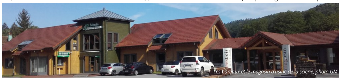
Les bureaux et le magasin d'usine de la scierie