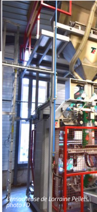
L'ensacheuse de Lorraine Pellets