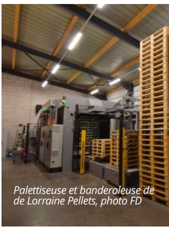
Palettiseuse et banderoleuse de Lorraine Pellets