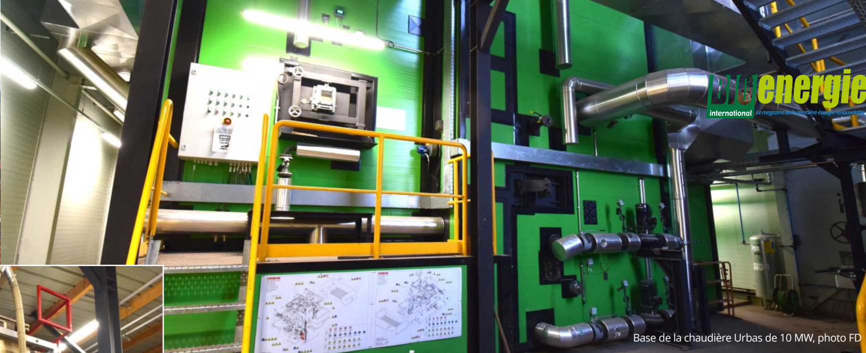
Base de la chaudière Urbas de 10 MW