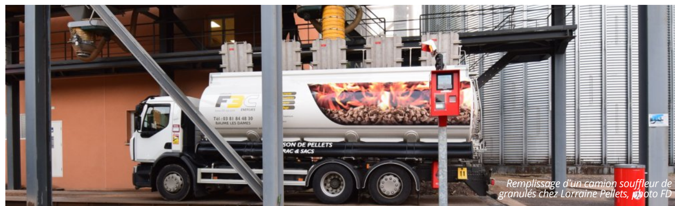
Remplissage d'un camion souffleur de granulés chez Lorraine Pellets