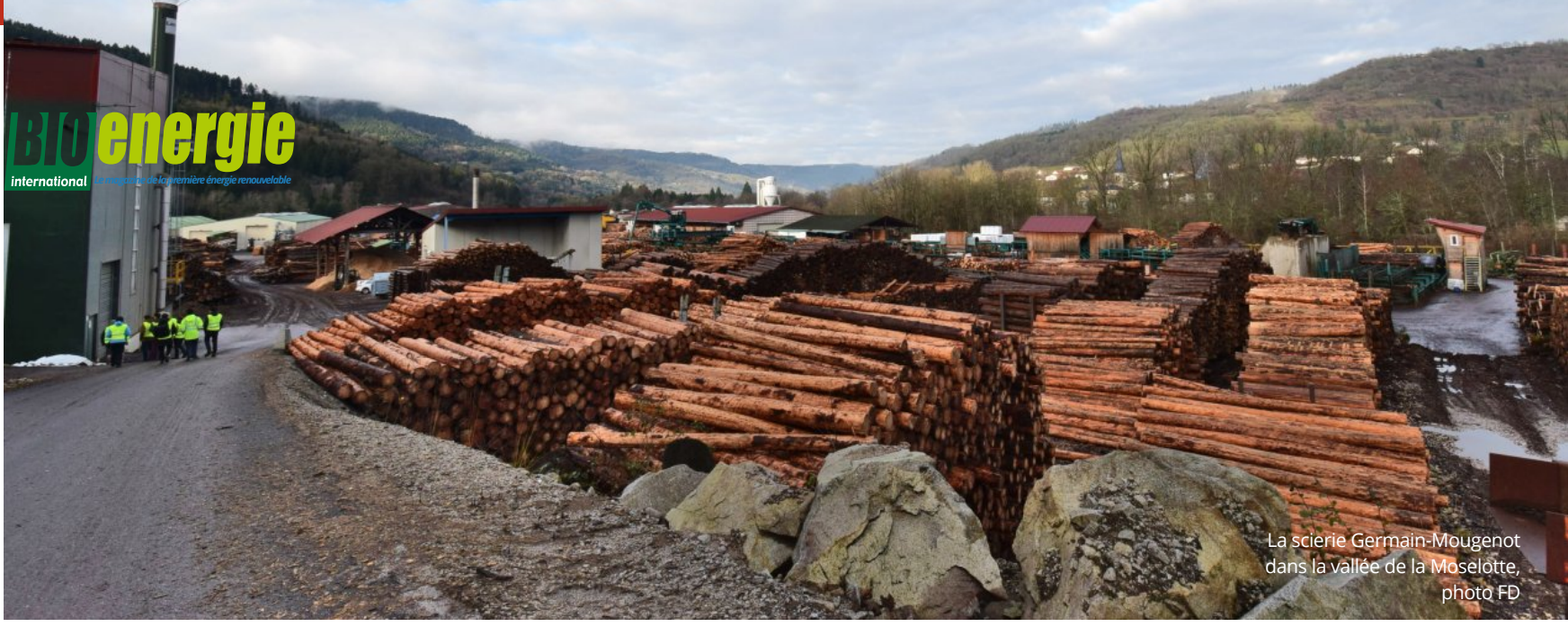
La scierie Germain-Mougenot dans la vallée de la Moselotte

bioenergie international la réponse de la première énergie renouvelable